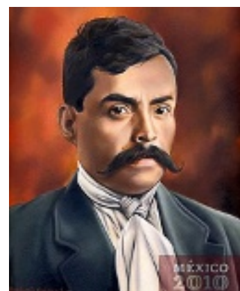
► Emiliano Zapata. Fue el primer retrato de la galería que realizó el pintor. Lo imaginó con un fondo rojo, por su carácter fuerte.