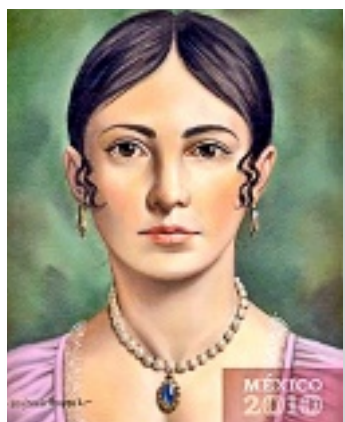
► Leona Vicario. En la época de la Independencia era una joven de 21 años. No hay obras que la muestren de esa edad.

► Los 50 retratos, pintados por Benjamín Orozco López, son de acceso libre