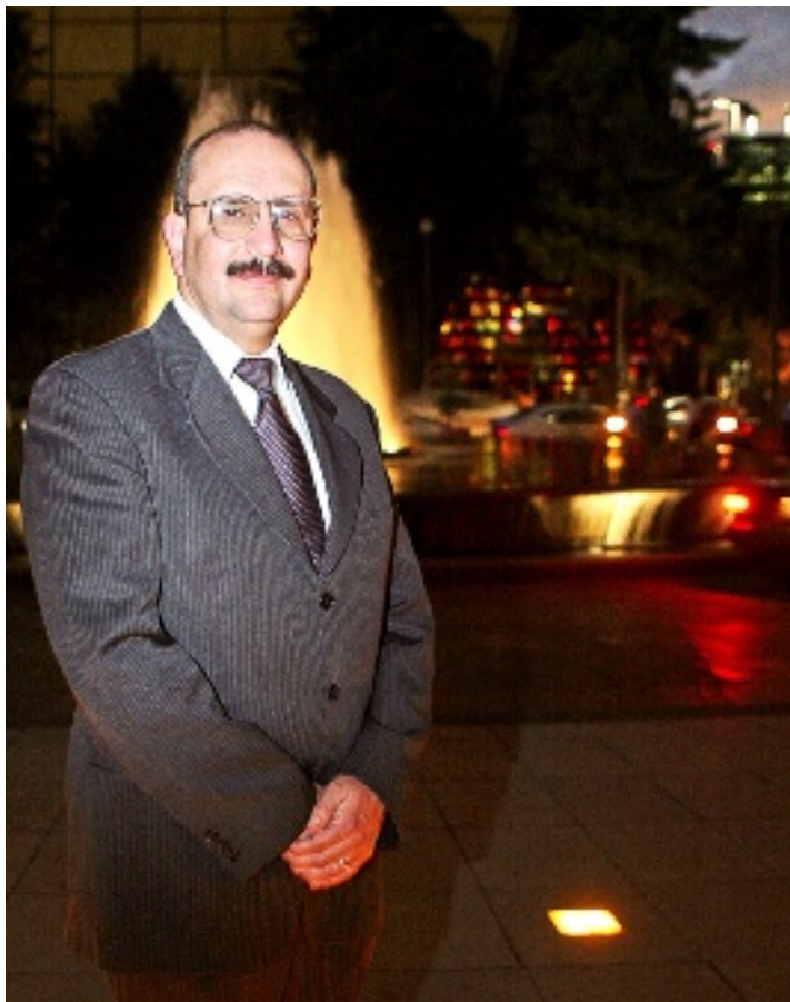
► Benjamín Orozco López elaboró 50 retratos: 23 de la Independencia, 3 de la Reforma, y 24 de la Revolución.

Santa Anna, aclara, no desempeñó un papel importante en la Independencia. "Se adhiere al Plan de Iguala (en 1821), como muchos otros militares realistas; todos tienen el mismo peso". Maximiliano no tenía por qué ser incluido: "Llega en medio de la batalla de liberales y conserva-