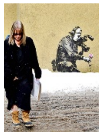
► Obra de Banksy creada durante el pasado Festival de Sundance.

through the gift shop" ( Salga por la tienda de souvenirs ), ya había sido presentada en el festival de Sundance, celebrado hace unos días. Ahí también levantó gran expectativa su presencia.