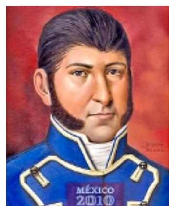
► Agustín de Iturbide. Quien consumó la Independencia fue retratado con uniforme del ejército realista.