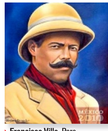
► Francisco Villa. Para contrarrestar su imagen de bandolero, su atuendo remite a su condición de militar.

el libro escolar, que muestra distorsionado al personaje. Lo que yo intenté es que se vieran más humanos".